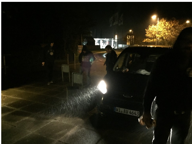
Jossain saksan ja köpiksen välissä.